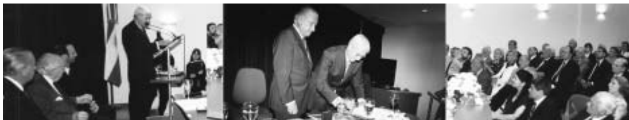
Imágenes de la Ceremonia de Entrega del Doctorado Honoris Causa del IUCS al Prof. Dr. Elías Hurtado Hoyo.

Engloban a un grupo de afecciones muy relacionadas a lo social que están latentes y que periódicamente recrudecen por haber fallado los mecanismos de prevención y control del Estado y/o de la comunidad, o porque no se pueden eliminar. Son la expresión la mayoría de las veces del fracaso del ser humano. Siguen generando los mayores índices de mortalidad y morbilidad.